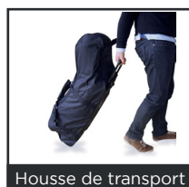
Housse de transport