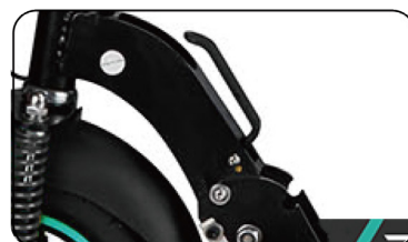
Système de pliage rapide